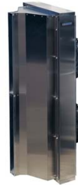
КЭВ-П5150A КЭВ-П5160A КЭВ-125П5150W КЭВ-175П5160W

Завесы серии 500 предназначены для защиты ворот высотой от 4 до 6 м крупных промышленных предприятий, железнодорожных депо, складов.